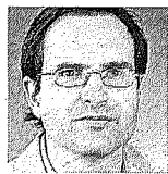
von André Widmer

Eine geplante Gemeindefusion kann zur emotionalen Sache werden, wenn die rationalen Gründe ausgehen. Das hat die Infoveranstaltung in Egolzwil zur vorgesehenen Zusammenlegung mit Wauwil gezeigt. Gut, dass es bei einzelnen, offenbar von negativen Vorbelastungen gefärbten Voten blieb. Es ist zu hoffen, dass die Neinsager auch beim Urnen-